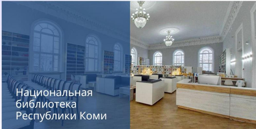
Национальная библиотека Республики Коми