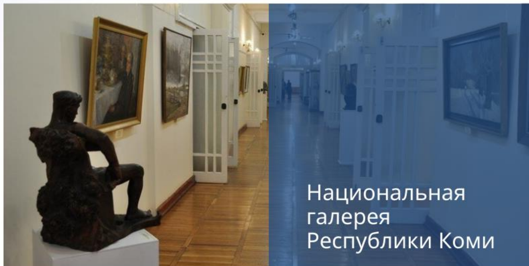
Национальная галерея Республики Коми