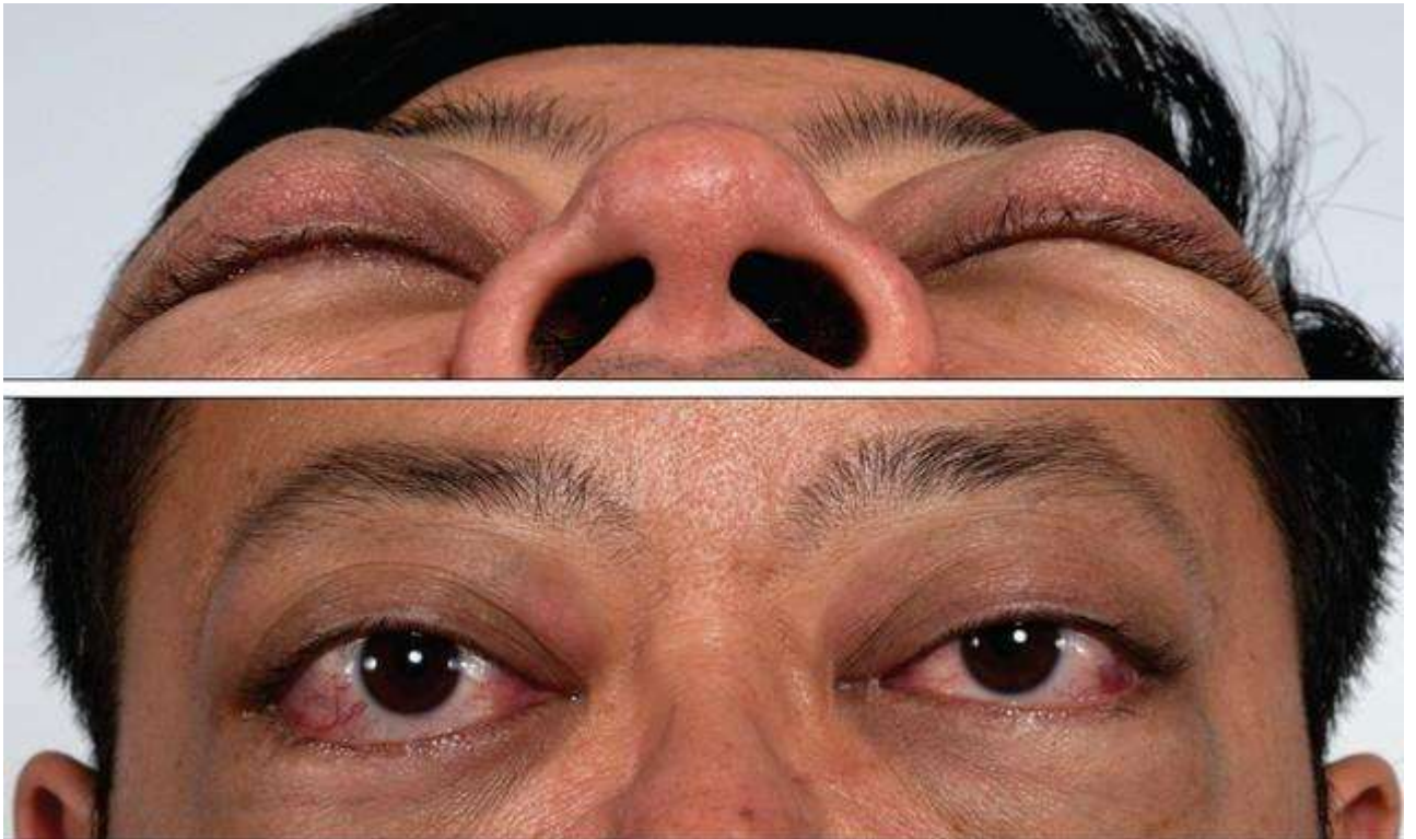
Рис. 1 Ваш