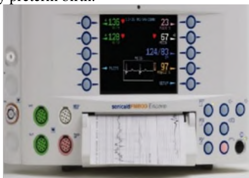
Figure 1: Sonicaid Team («Oxford Instruments Medical», Great Britain)

At present, to determine the status of antenatal fetus often use fetal monitors Sonicaid Team ( «Oxford Instruments Medical», UK) with the program "System 8000". Criteria for evaluation of CTG automated data in real time have been designed G.Dawes, C.Redman and M.Moulden and are based on multivariate statistical retrospective clinical evaluation of tens of thousands of CTG. The data is compared with the patient's specific regulatory credible indicators, taking into account the duration of pregnancy. Using of this program is already possible from 24 weeks of pregnancy, that is, with the terms of the very early preterm birth.