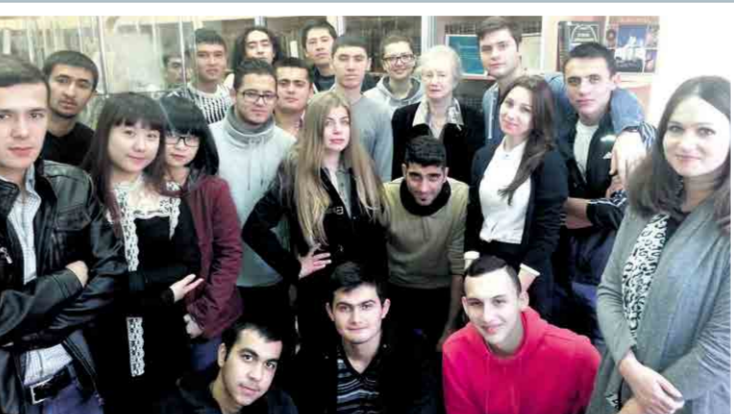
На снимке - студенты МИМОС 101-2 си

Музей редкой книги ждет своих посетителей каждый день, сюда можно вернуться в любое время, найти помощь в подготовке реферата, познакомиться с богатыми фондами музеев мира, повысить свой общекультурный уровень. Как известно, книга - верный товарищ во все времена, на которую всегда можно положиться, а встреча с редкой книгой - это еще одна редкая возможность найти хороших друзей.