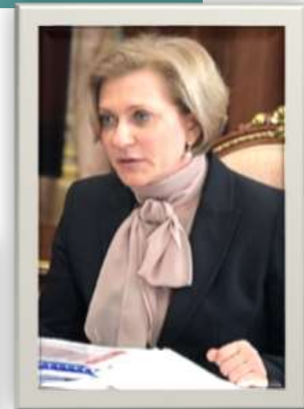
Попова А.Ю. – главный государственный санитарный врач