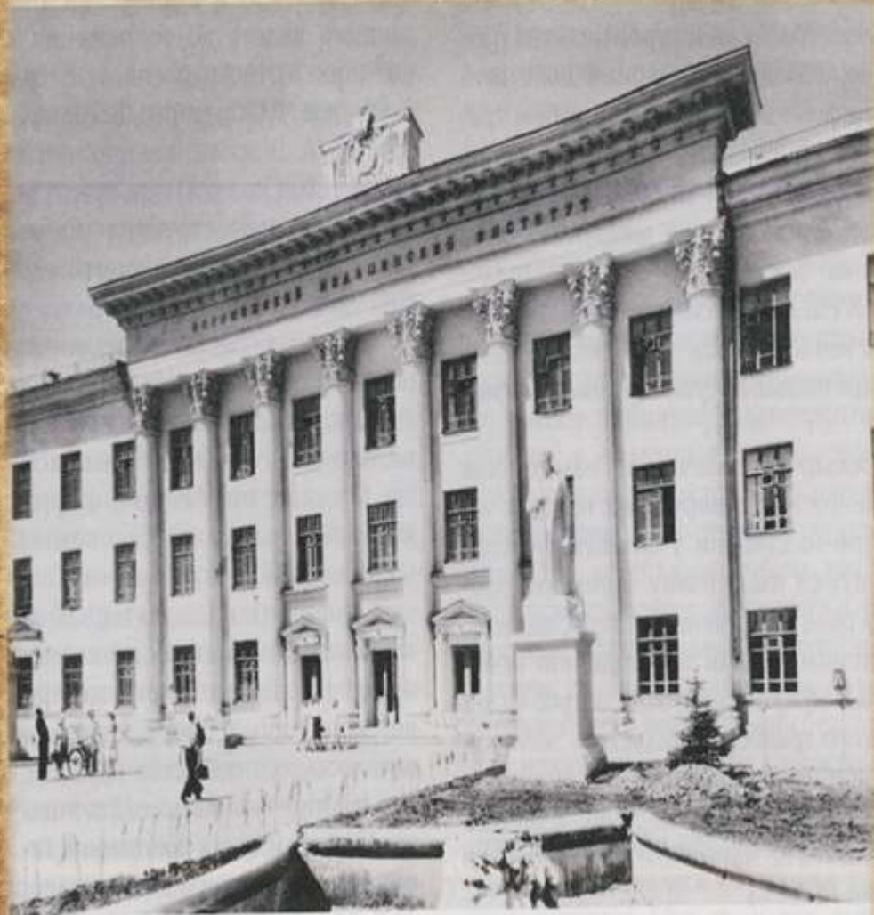
Воронеж. Здание медицинского института. 1952 г. Реконстр. арх. М. Георгиевского

История возникновения медико-профилактического факультета, прежнее название – санитарно-гигиенический, связана со временем становления медицинского института г. Воронежа.