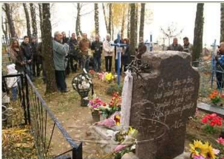
Могила Анатолия Жигулина на Троекуровском кладбище в Москве.