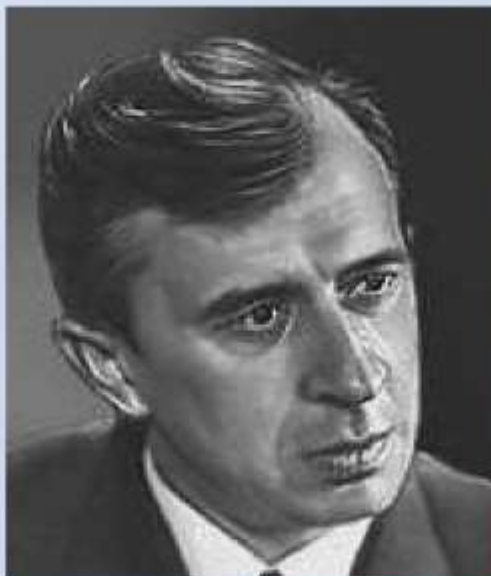
А.В. Жигулин (1930-2000)