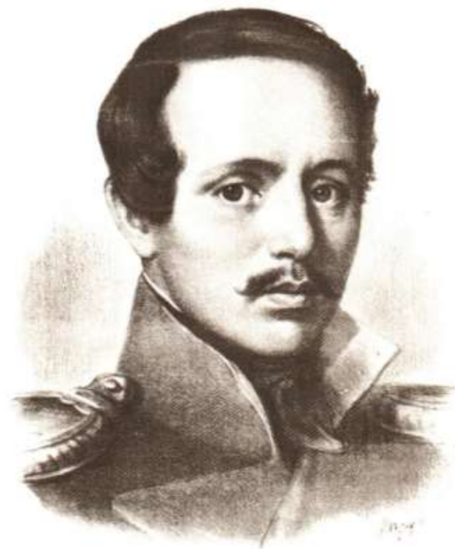
Михаил Юрьевич ЛЕРМОНТОВ (1814—1841)