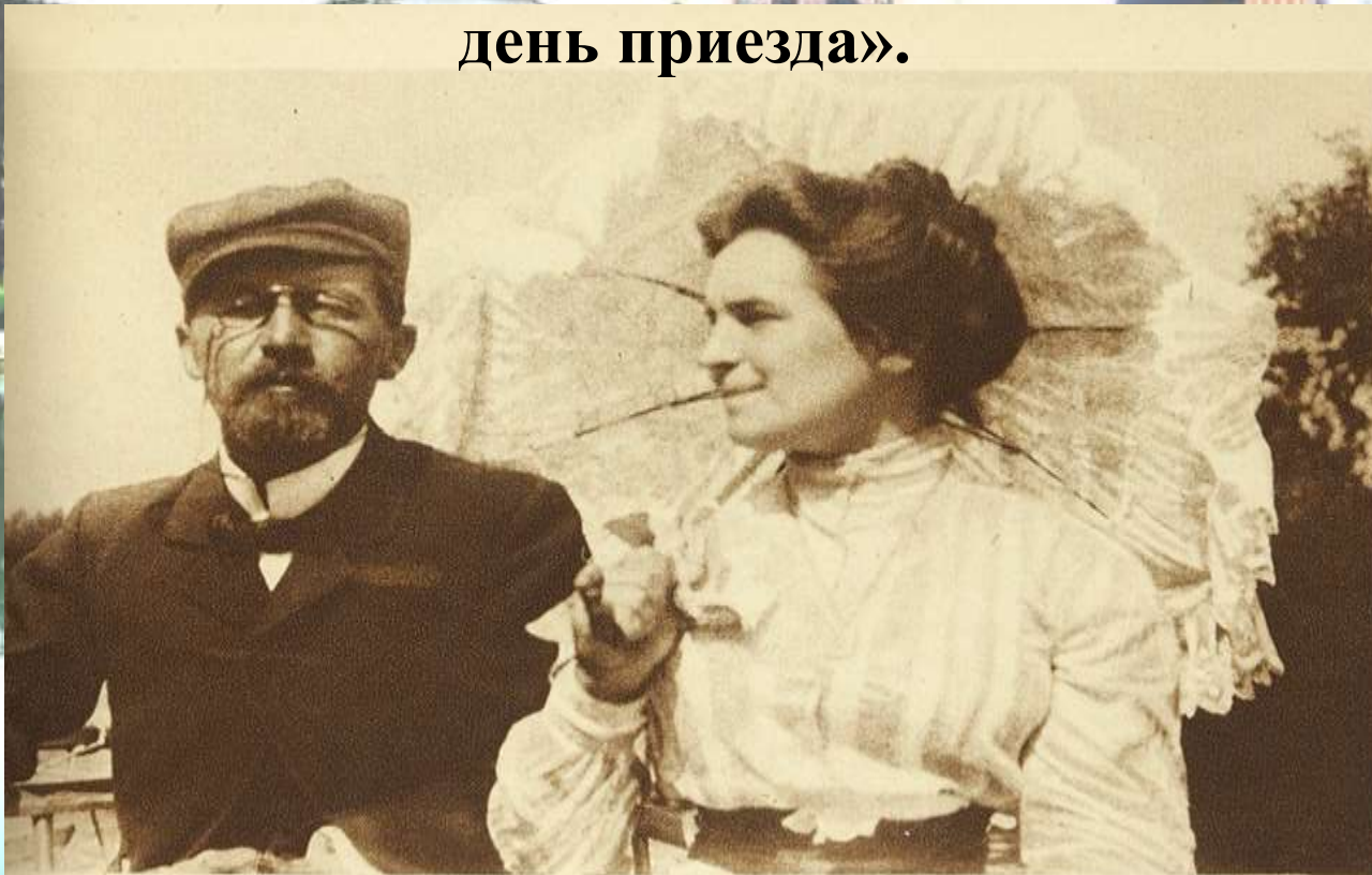
А. П. Чехов с О. Л. Книппер-Чеховой.

Ольга Книппер и Антон Чехов венчались тайно 25 мая 1901г. Почтовый роман Ольги Книппер и Антона Чехова длился до 1901 года. 25 мая 1901 года они венчаются. Свадьба была тайной, это было условие Чехова. «Если даешь слово, - писал он, - что ни одна душа в Москве не будет знать о нашей свадьбе до тех пор, пока она не свершится, то я повенчаюсь с тобой хоть в день приезда».