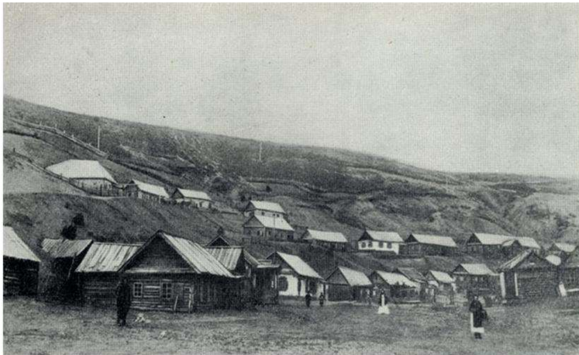
О. Сахалин. Слобода ссыльных. Фотография из личной коллекции Чехова, 1890г.

На Сахалине Чехова интересовало буквально все: климат, гигиенические условия тюрем, пища и одежда арестантов, жилища ссыльных, состояние сельского хозяйства и промыслов, система наказаний, которым подвергались ссыльные, положение женщин, жизнь детей и школы, медицинская статистика и больницы, метеорологические станции, жизнь коренного населения и сахалинские древности. Из 65 русских селений, обозначенных на карте Сахалина 1890 года, Антон Павлович описал или упомянул 54, а лично посетил 39 селений. В условиях тогдашнего бездорожья и неустроенности жизни на острове сделать это мог только такой самоотверженный человек, каким был А.П. Чехов.