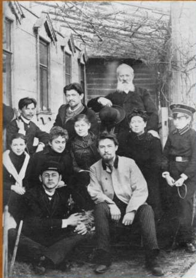
А.П. Чехов с семьей перед отъездом на о. Сахалин.

В 1890 г. в жизни А.П. Чехова произошло важное событие – поездка на остров Сахалин, результатом которой явилась его известная книга. Никто не знает, зачем было ехать Чехову на Сахалин. Родные и близкие считают, что эта поездка была случайной, импульсивной и даже необдуманной. Сам Чехов от родни свои намерения скрывал, прямо отвечать на этот вопрос уклонялся, а о своем решении поехать на Сахалин объявил официально незадолго до нее.