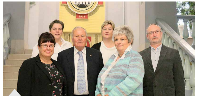
Специалисты выразили надежду, что партнерские связи с ВГУ будут развиваться и дальше