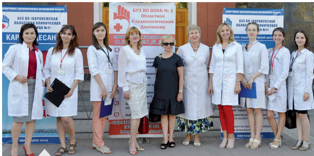
В ходе анкетирования специалисты опросили более 200 человек