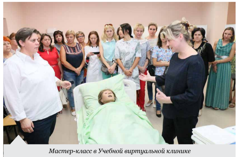
Мастер-класс в Учебной виртуальной клинике