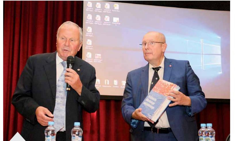
На церемонии торжественного открытия мероприятия