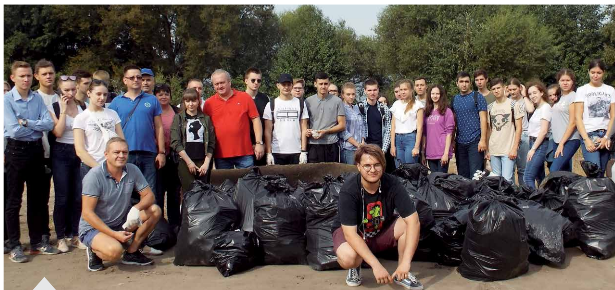
Главная цель Экологического волонтерства – привлечение общественного внимания к вопросам охраны живой природы