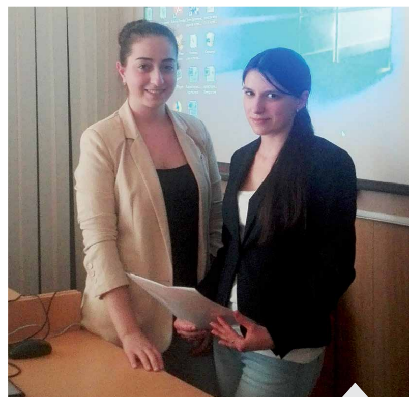
Студентки ВГМУ им. Н.Н. Бурденко после окончания открытого урока