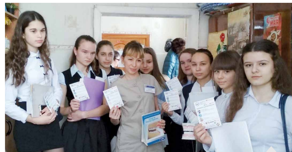
3000 учеников средних школ были проконсультированы представителями ВГМУ

Была проведена акция: бесплатный первичный осмотр и консультация у врачей стоматологов-хирургов, врачей стоматологов-терапевтов, врачей стоматологов-ортопедов. Более 60 человек получили консультацию высококвалифицированных специалистов бесплатно.