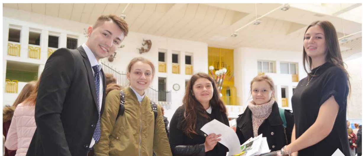
ВГМУ им. Н.Н. Бурденко представляли: центр довузовского медицинского образования и профориентации, студенты 5 курса стоматологического факультета

12 апреля во Дворце творчества детей и молодежи состоялась традиционная ярмарка вакансий, профессий и ученических мест: «Профессия – твой выбор». Она организована Центром занятости населения «Молодежный» совместно с управлением образования и молодежной политики администрации городского округа город Воронеж.