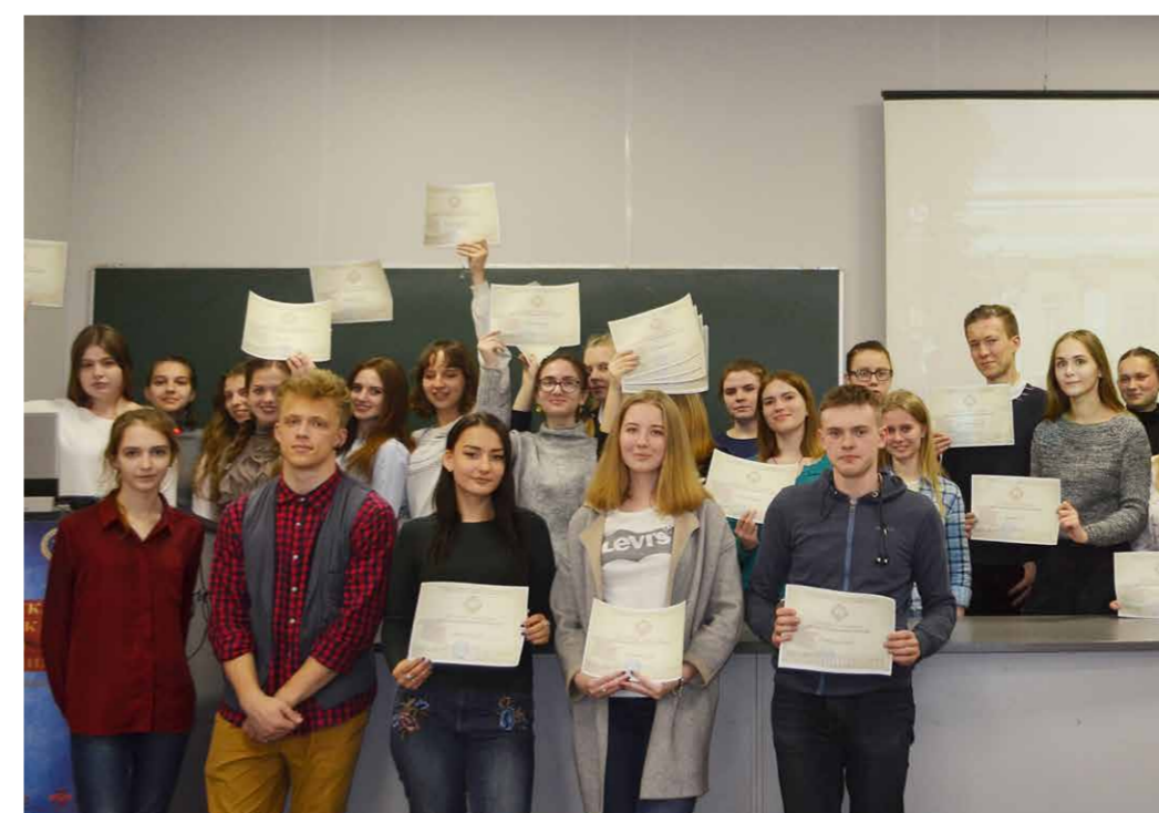
Участники «Школы медицинских знаний» получили сертификаты