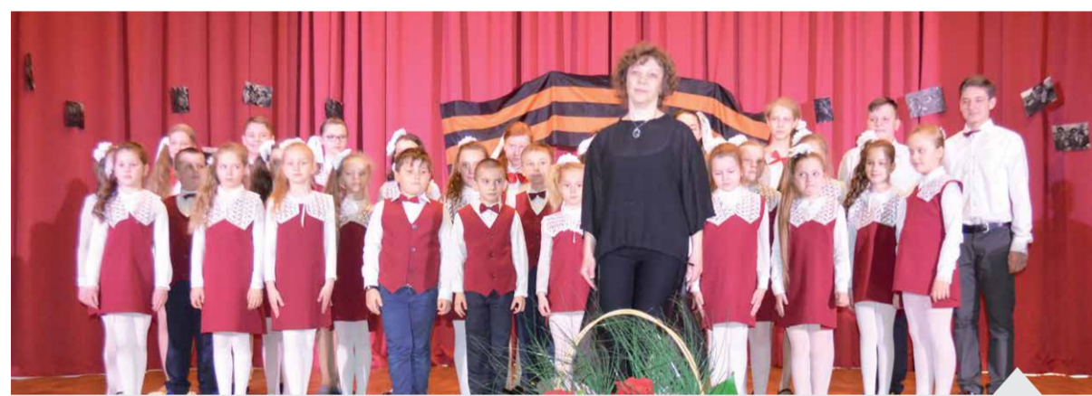
Участники детского хора «Солнечный круг» вместе с руководителем

Шестнадцать песенных и танцевальных выступлений организовала кафедра философии и гуманитарной подготовки ВГМУ им. Н.Н. Бурденко. На сцене прозвучали песни: «Жизнь», «Жди меня», «Милосердие», «Россия, вперед!» и многие другие. Студенты исполнили танцевальные номера, среди которых: «Ты же