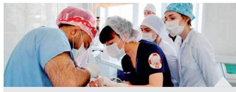
Практические занятия на кафедре челюстно-лицевой хирургии

Следует отметить, что это уже пятый визит представителей Университета Чукурова в ВГМУ