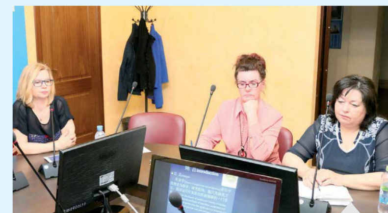
С китайскими коллегами была достигнута договоренность о продолжении проведения видео-лекций и мастер-классов