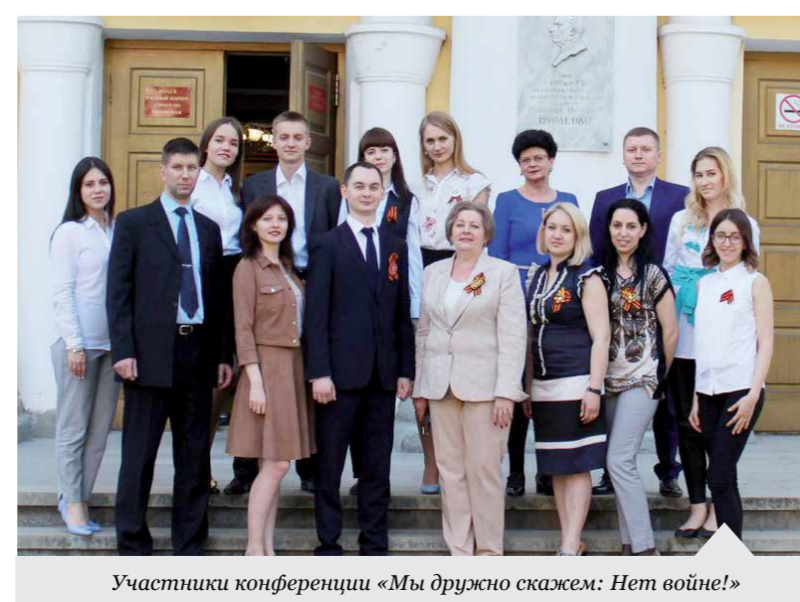
Участники конференции «Мы дружно скажем: Нет войне!»