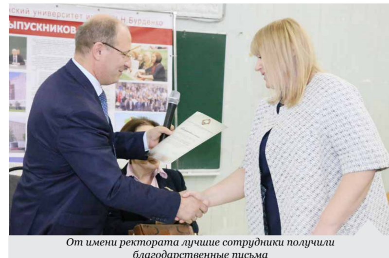
От имени ректората лучшие сотрудники получили благодарственные письма

стов-выпускников награждены главы администраций Бобровского, Острогожского, Рамонского, Новохоперского районов, БСМП №10 «Электроника», БУЗ ВО «Воронежская областная детская клиническая больница №1», БУЗ ВО «Воронежская городская клиническая поликлиника №1», БУЗ ВО «Воронежская городская клиническая поликлиника №7», ФГБУЗ «МСЧ №33 ФМБА России», БУЗ ВО «Бобровская районная больница», БУЗ ВО «Новохоперская районная больница», БУЗ ВО «Острогожская районная больница», БУЗ ВО «Рамонская районная больница».