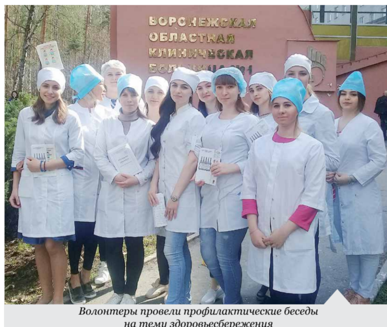
Волонтеры провели профилактические беседы на тему здоровьесбережения

Здоровый образ жизни для современного человека не пустой звук. Современная молодежь часто посещает спортивные секции, танцевальные кружки, бассейны и т.д. Модными современными направлениями являются пилатес, йога, стрейчинг, бодифлекс, тайбо и другие. Однако занятия спортом чаще всего проходят нерегулярно, или вообще единично. Более того, большинство людей не обращает внимание на свое питание и не считает вредные привычки такими уж губительными.