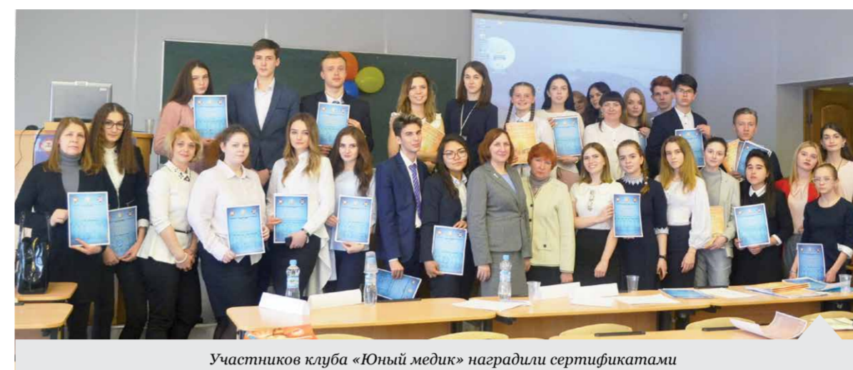
Участников клуба «Юный медик» наградили сертификатами

Занятия с учащимися в клубе «Юный медик» в этом учебном году подошли к завершению. Ребята в течение года регулярно посещали занятия и мероприятия, проводимые клубом «Юный медик», предоставляли отчеты о своей деятельности в клубе под руководством кураторов.