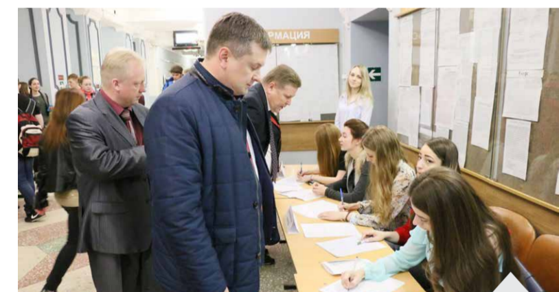
Все вакансии, представленные на Ярмарках, теперь можно найти на сайте ВГМУ