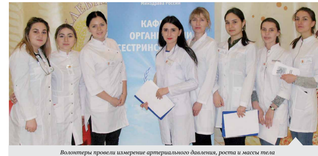
Волонтеры провели измерение артериального давления, роста и массы тела

провели измерение артериального давления, роста, массы тела, определяли индекс массы тела, после чего (при необходимости), направляли посетителей на консультацию к сотрудникам кафедры Организации сестринского дела. Сотрудники кафедры консультировали желающих по вопросам рационального питания, здоровому образу жизни. Помимо этого, сотрудники