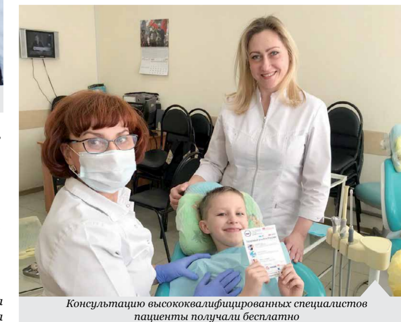
Консультацию высококвалифицированных специалистов пациенты получали бесплатно

На базе стоматологической поликлиники ВГМУ им. Н.Н. Бурденко прошли мероприятия, посвященные «Всероссийскому Дню Стоматологического Здоровья». Главная цель Дня – рассказать населению о важности соблюдения правил гигиены полости рта, осведомить о взаимосвязи здоровья зубов и тканей пародонта с состоянием органов и систем всего организма.