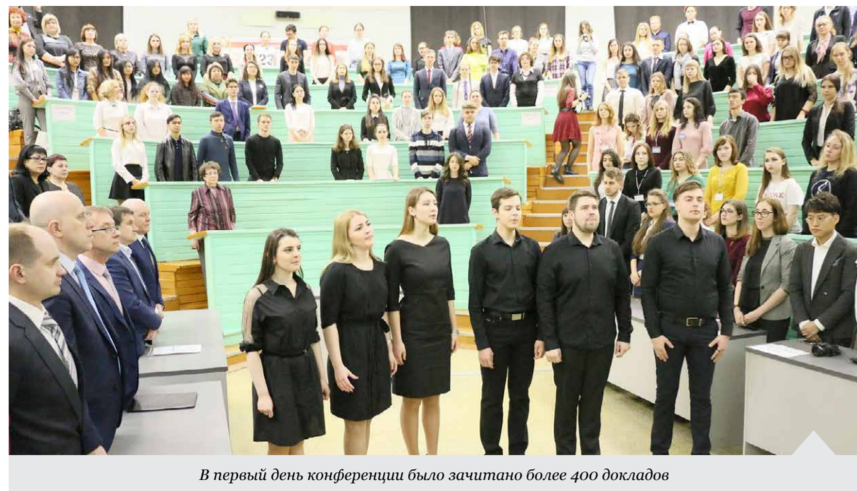
В первый день конференции было зачитано более 400 докладов