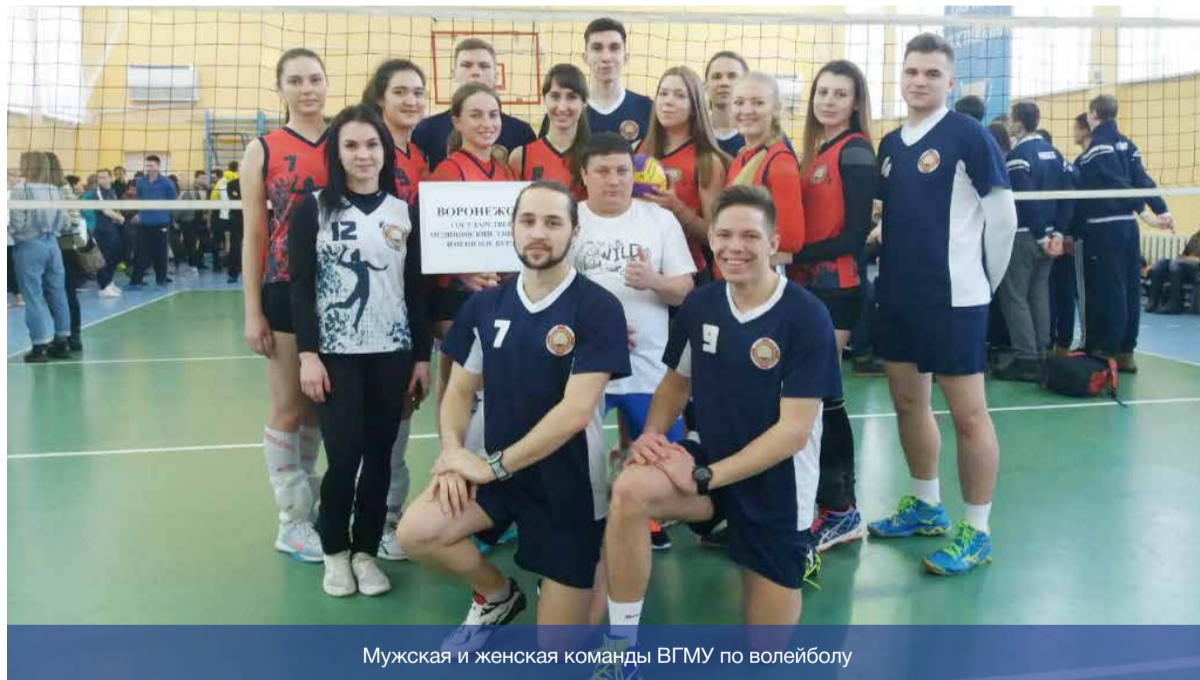
Мужская и женская команды ВГМУ по волейболу