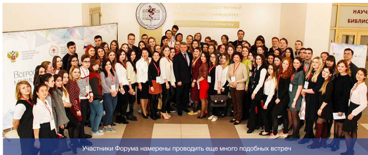
Участники Форума намерены проводить еще много подобных встреч