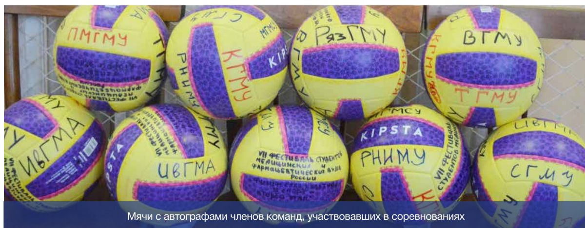
Мячи с автографами членов команд, участвовавших в соревнованиях