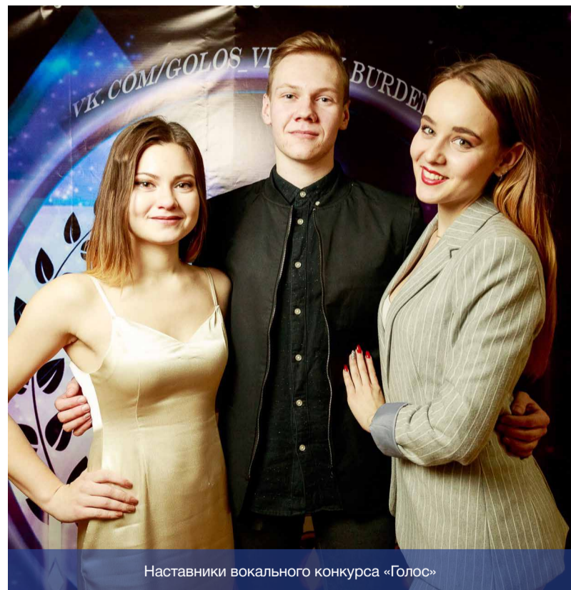
Наставники вокального конкурса «Голос»