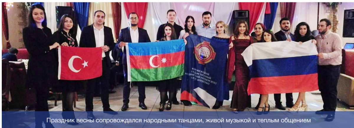
Праздник весны сопровождался народными танцами, живой музыкой и теплым общением

17 марта в студенты ВГМУ им. Н.Н. Бурденко отметили праздник весны – Новруз Байрам. Это праздник весны по солнечному летоисчислению у иранских и тюркских народов, который совпадает с днем весеннего равноденствия. Приятно осознавать, что обучающиеся ВГМУ им. Бурденко, а по совместительству и представители азербайджанской диаспоры, собрались вместе для того, чтобы весело отметить этот праздник.