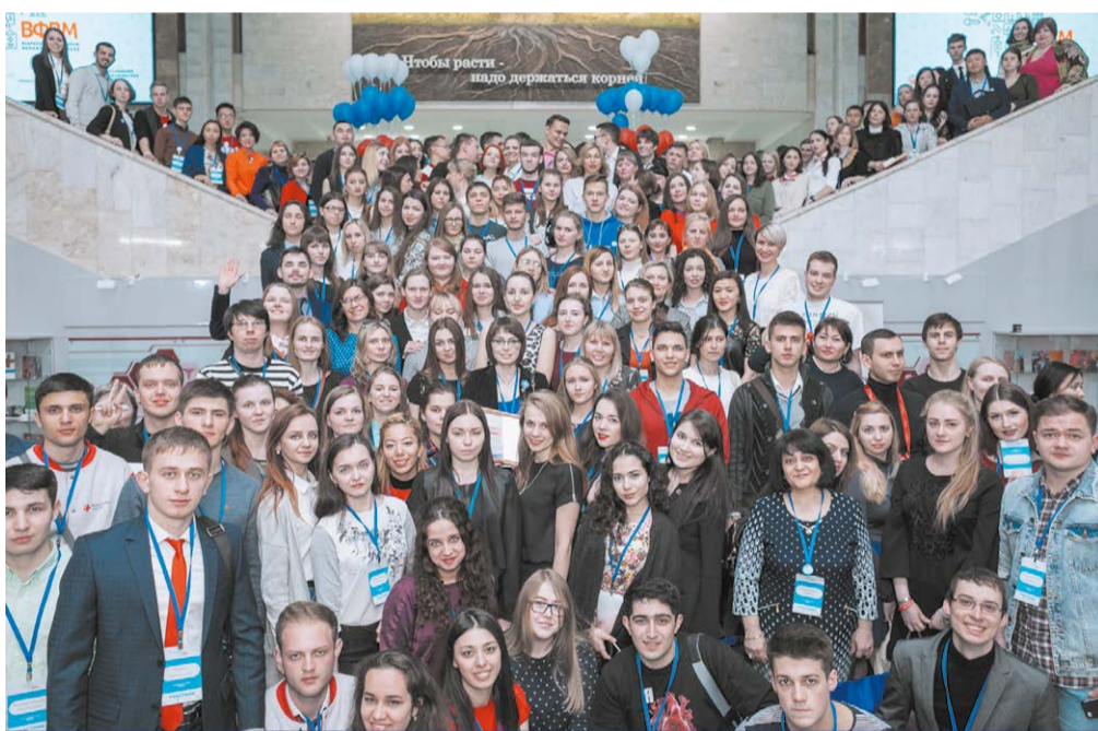
Участники II Всероссийского форума Волонтеров-медиков