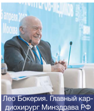
Лео Бокерия. Главный кардиохирург Минздрава РФ

Габриела Завалина