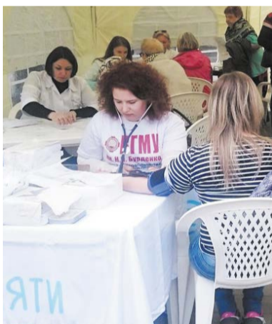
Студентки ВГМУ проводят консультацию