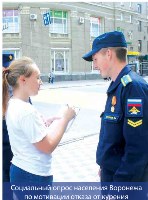
Социальный опрос населения Воронежа по мотивации отказа от курения