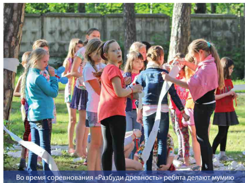
Во время соревнования «Разбуди древность» ребята делают мумию