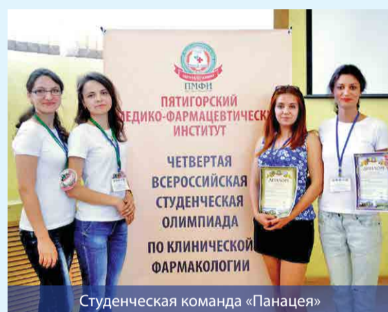
Студенческая команда «Панацея»

Команда ВГМУ им. Н.Н. Бурденко в четвертый раз стала участником Всероссийской олимпиады по клинической фармакологии. В 2016 году соревнование проходило в Пятигорске.