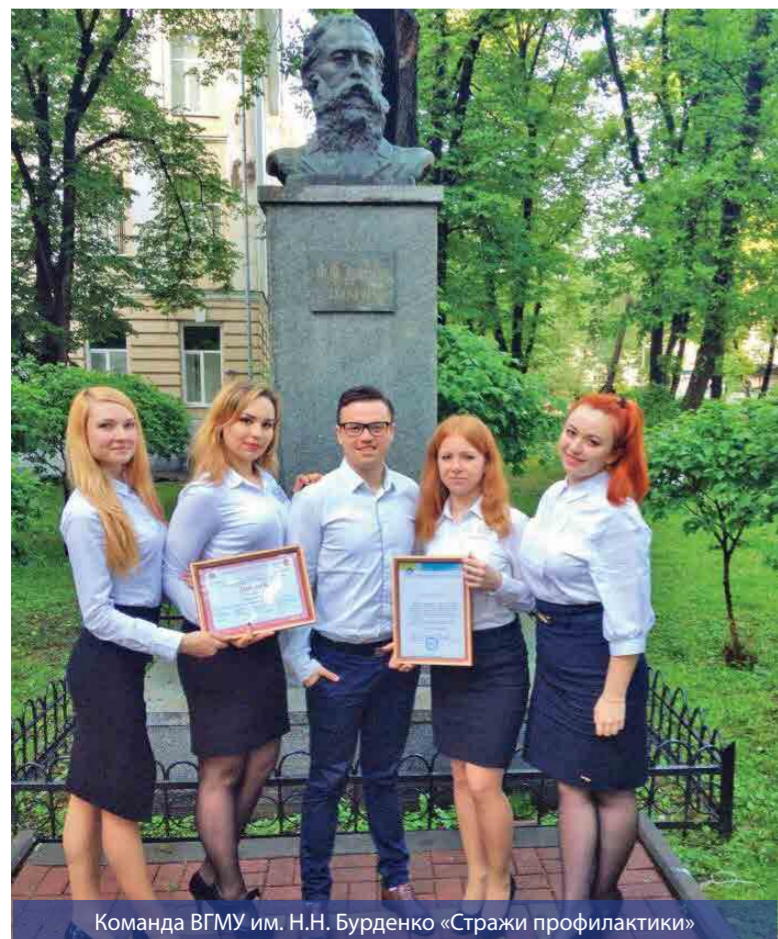
Команда ВГМУ им. Н.Н. Бурденко «Стражи профилактики»

На базе Первого МГМУ им. И.М. Сеченова 20 мая 2016 года состоялась Всероссийская студенческая олимпиада по эпидемиологии.