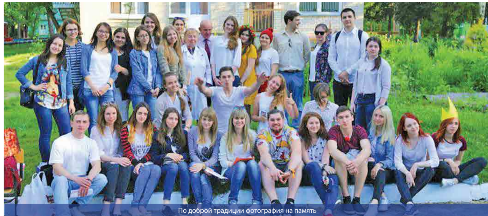
По доброй традиции фотография на память