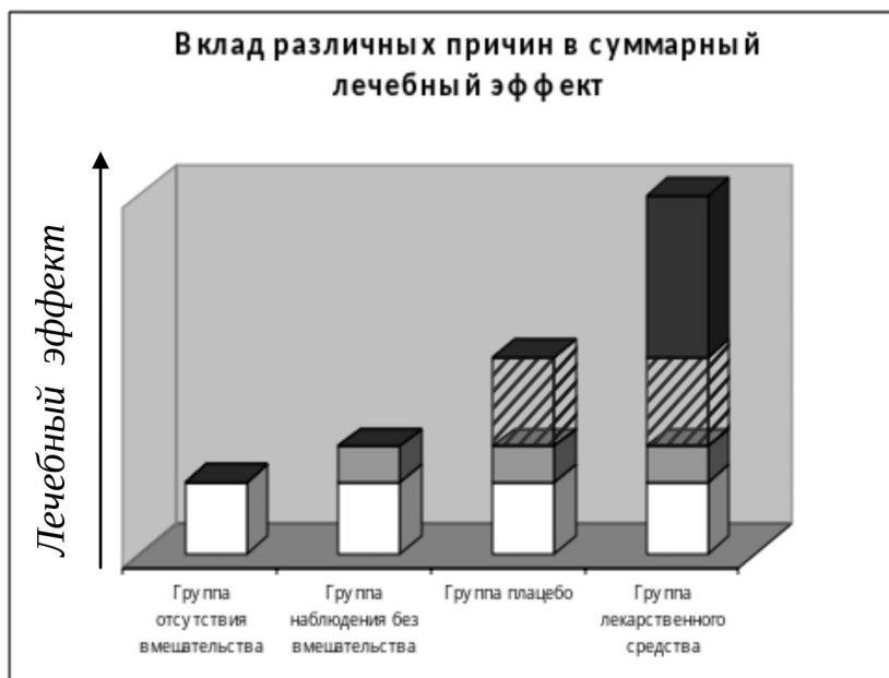
Рис. Вклад различных причин в суммарный лечебный эффект.