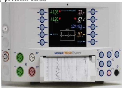
Figure 1: Sonicaid Team («Oxford Instruments Medical», Great Britain)

At present, to determine the status of antenatal fetus often use fetal monitors Sonicaid Team («Oxford Instruments Medical», UK) with the program "System 8000". Criteria for evaluation of CTG automated data in real time have been designed G.Dawes, C.Redman and M.Moulden and are based on multivariate statistical retrospective clinical evaluation of tens of thousands of CTG. The data is compared with the patient's specific regulatory credible indicators, taking into account the duration of pregnancy. Using of this program is already possible from 24 weeks of pregnancy, that is, with the terms of the very early preterm birth.