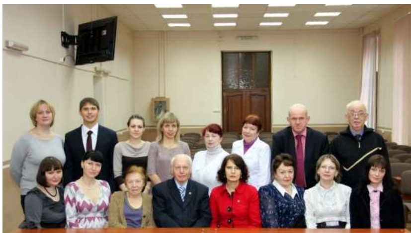
Кафедра нормальной физиологии (2013 год)

16-18 апреля 2015 г. в Воронеже прошел III МЕЖДУНАРОДНЫЙ СИМПОЗИУМ «Структура и функции автономной (вегетативной) нервной системы», организаторами которого стали Физиологическое Общество им. И.П. Павлова, НИИ нормальной физиологии им. П.К. Анохина, ВГМА им. Н.Н. Бурденко и Департамент Здравоохранения Воронежской области. В рамках проведения Симпозиума 16 апреля 2015 года в Воронежском государственном медицинском университете прошла международная физиологическая школа с участием ведущих ученых-физиологов России и Ближнего Зарубежья. В рамках школы было прочитано пять лекций студентам 1-3 курсов ВГМУ им. Бурденко, на котором присутствовало более 600 студентов и преподавателей.