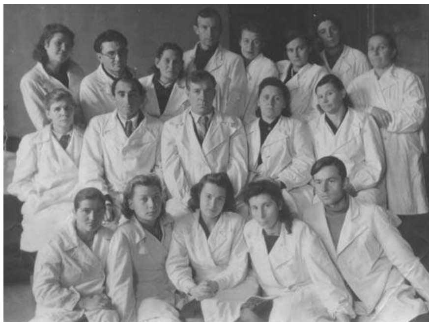
Кафедра нормальной физиологии (1947 год)