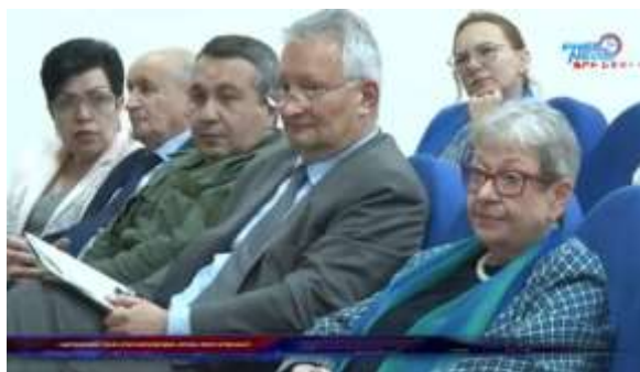
Участие в международной конференции «NEUROSCIENCE WEEK», г. Ереван, Армения