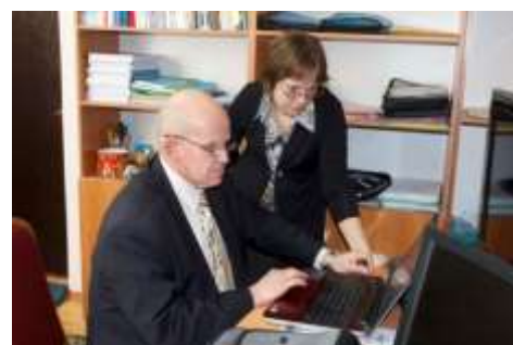
Душанбе, Таджикистан, 2014