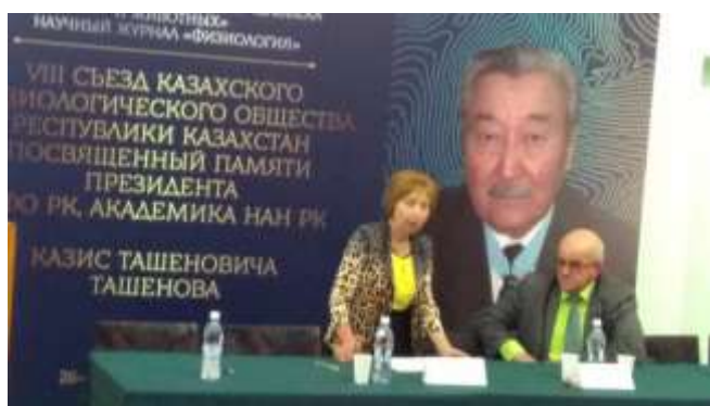
Астана, Казахстан, 2019