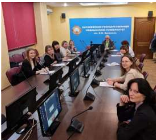
Международная научно-практическая конференция, Душанбе, Таджикистан в виде телемоста 2020

Даже в проблемный 2020 год кафедральцы продолжали свой славный путь: выходили в свет учебники, сотрудники активно занимались научной работой и принимали участие в конференциях.