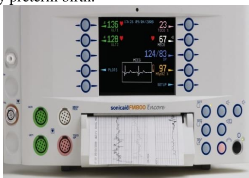
Figure 1: Sonicaid Team («Oxford Instruments Medical», Great Britain)

At present, to determine the status of antenatal fetus often use fetal monitors Sonicaid Team («Oxford Instruments Medical», UK) with the program "System 8000". Criteria for evaluation of CTG automated data in real time have been designed G.Dawes, C.Redman and M.Moulden and are based on multivariate statistical retrospective clinical evaluation of tens of thousands of CTG. The data is compared with the patient's specific regulatory credible indicators, taking into account the duration of pregnancy. Using of this program is already possible from 24 weeks of pregnancy, that is, with the terms of the very early preterm birth.