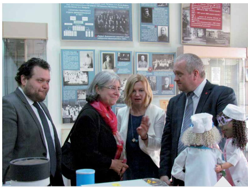
Прогулка по медуниверситету

Работа, проводимая в ВГМУ им. Н.Н. Бурденко в рамках разработки и внедрения здоровьесберегающих технологий, является приоритетным направлением деятельности вуза, позволяющим с позиций доказательной медицины формировать здоровьесберегающую среду, способствуя широкому распространению знаний в данной сфере, направленных на сохранение и приумножение основной ценности жизни – здоровья.