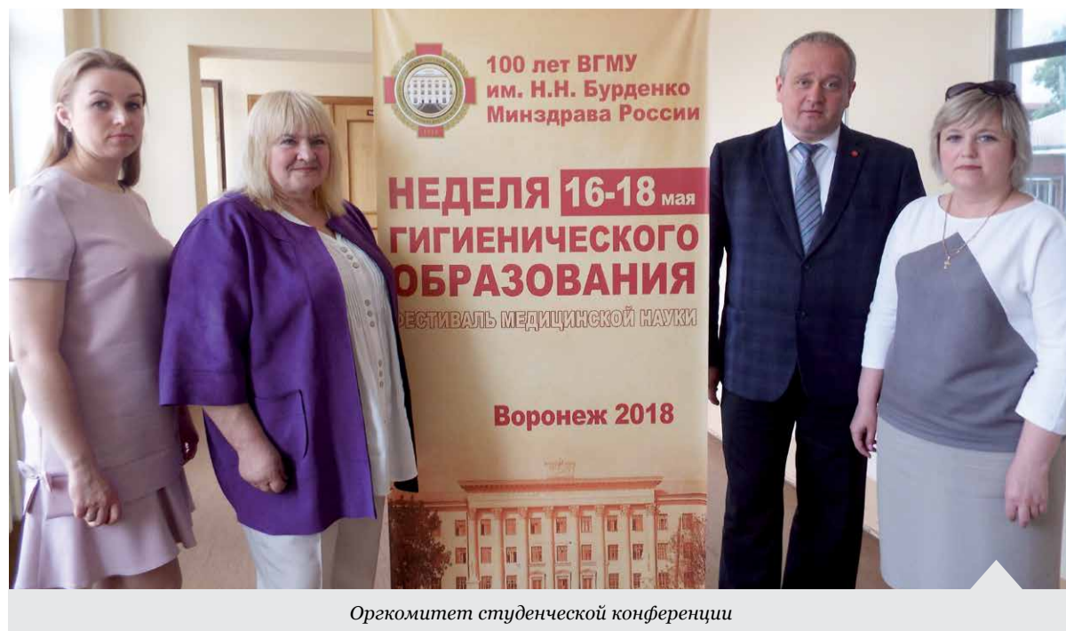
Оргкомитет студенческой конференции