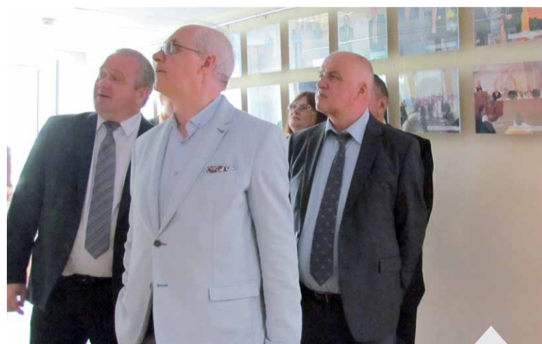
Фотовыставка, организованная кафедрой общей гигиены