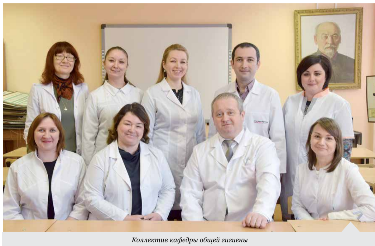
Коллектив кафедры общей гигиены

Следует отметить, что все мероприятия в рамках «Недели гигиенического образования» прошли плодотворно, вызвали большой интерес и эмоциональный отклик со стороны участников. Теплая и дружелюбная атмосфера мероприятий подарила участникам хорошее настроение и предоставила возможность для размышлений. Выставочные композиции, посвященные 100-летию ВГМУ им. Н.Н.