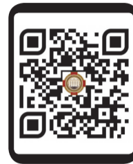
сайт ВГМУ им. Н.Н. Бурденко