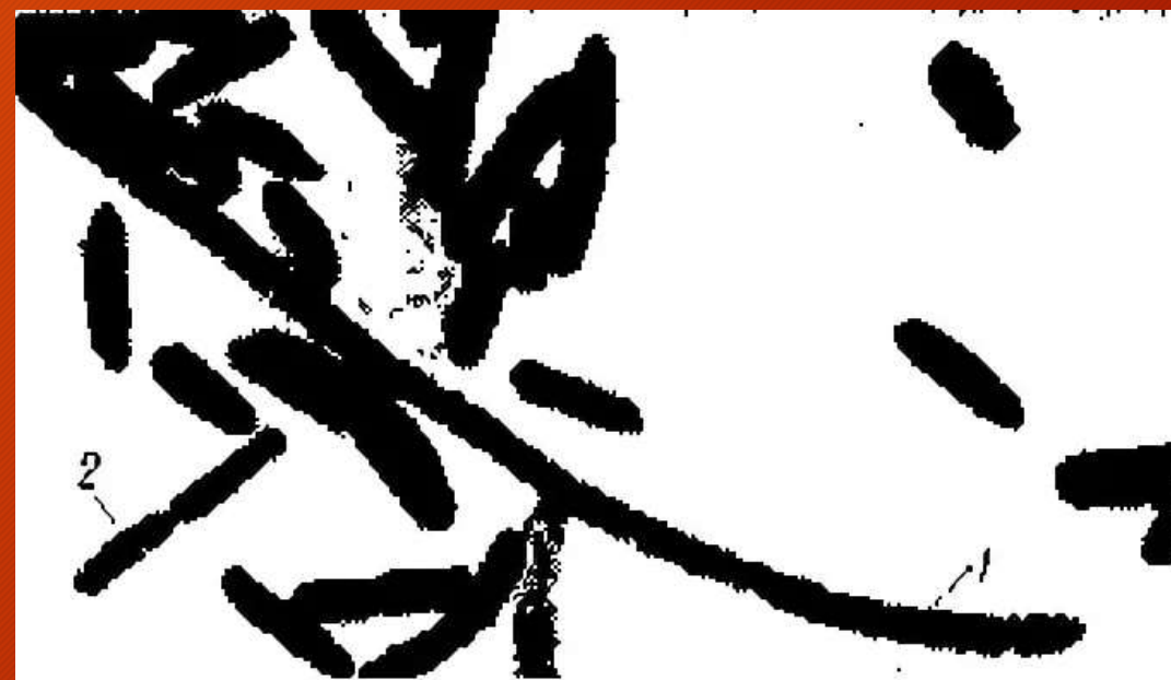
Рис. 1. Возбудители некробактериоза: нити (1) и палочки (2).

В 1930 году Михаил Васильевич расшифровал причину болезни леггорнов (это разновидность домашних кур), которой являлся некробациллёз.