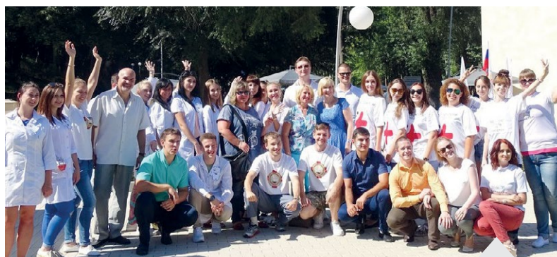
Воспитать настоящего врача задача непростая, но вполне решаемая

Кроме этого в ВГМУ на протяжении нескольких лет для студентов организуются физкультурпаузы и перемены производственной гимнастики. В 2011 году была разработана и введена в эксплуатацию модель многоуровневого и многофункционального научно-образовательного, спортивно-оздоровительного и консультативного «Академического центра здоровья студентов». В спортивно-оздоровительном комплексе доступен зал для занятий