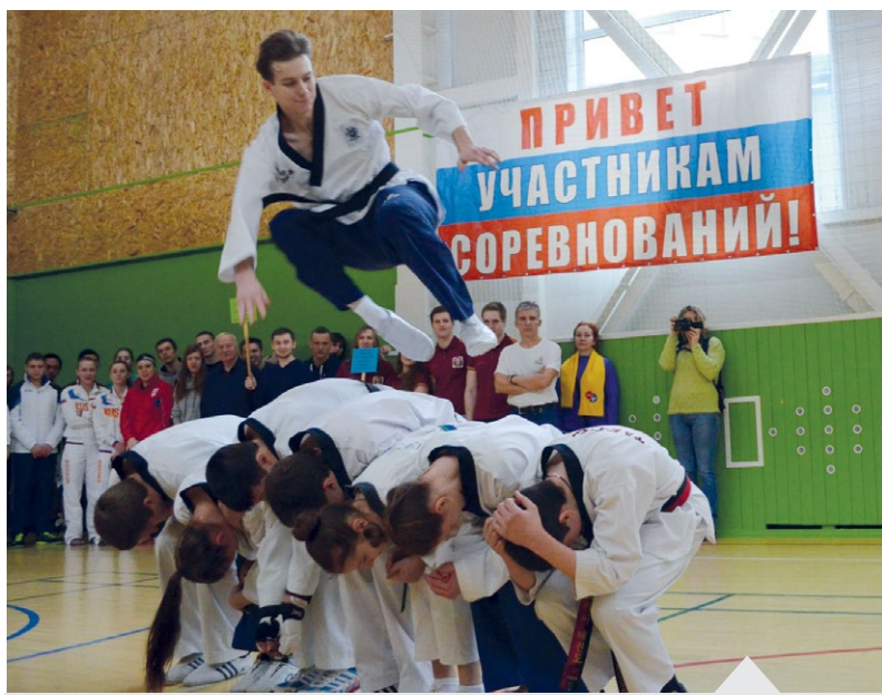
Спорт - основа для успешной реализации программы здоровьесбережения

Проект «Здоровье каждого – богатство страны» – это призыв к молодым людям вести здоровый образ жизни, отказаться от табака и алкоголя в пользу здоровых и активных форм отдыха молодежи. Для медицинских вузов это особенно важно, поскольку студенты-медики несут ответственность не только за свое, но и общественное здоровье. И через некоторое время им по долгу службы придется нести навыки сохранения и укрепления здоровья в массы.