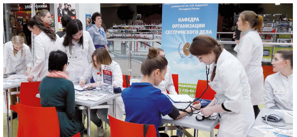
Волонтеры ВГМУ проводят измерение артериального давления