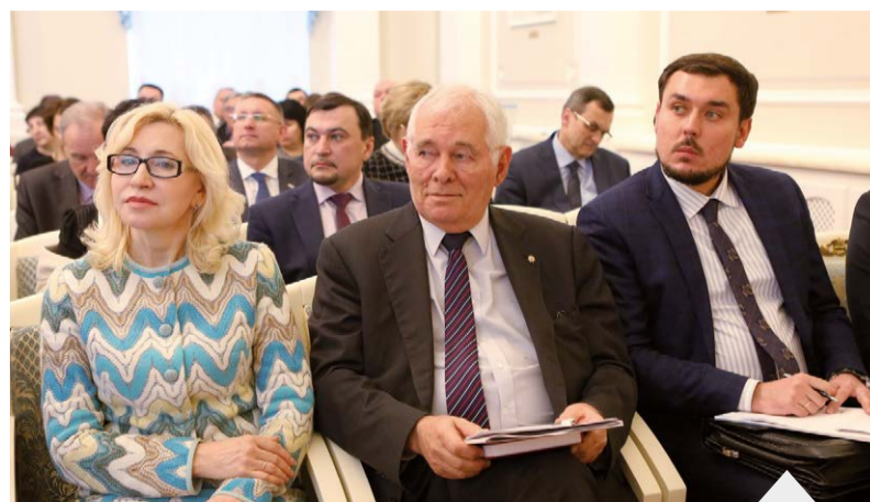
Участники совещания Совета ректоров

рования студентов, стимулирование создания и реализации в вузах инновационных программ и проектов, направленных на пропаганду здорового образа жизни, повышение качества физического воспитания, отказ от вредных привычек студентов и профессорско-преподавательского состава. Подготовка к конкурсу предпола-