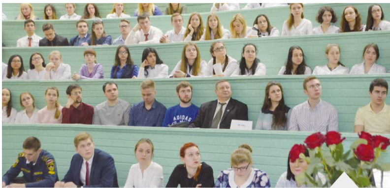
Студенты и курсанты основательно подошли к подготовке докладов

Межвузовская научно-практическая конференция «Современные аспекты техносферной безопасности при пожарах на территории Воронежской области» состоялась 29 марта в Центральной медицинской аудитории ВГМУ им. Н.Н. Бурденко. Мероприятие было посвящено 100-летию ВГМУ. В работе конференции приняло участие свыше 400 человек.