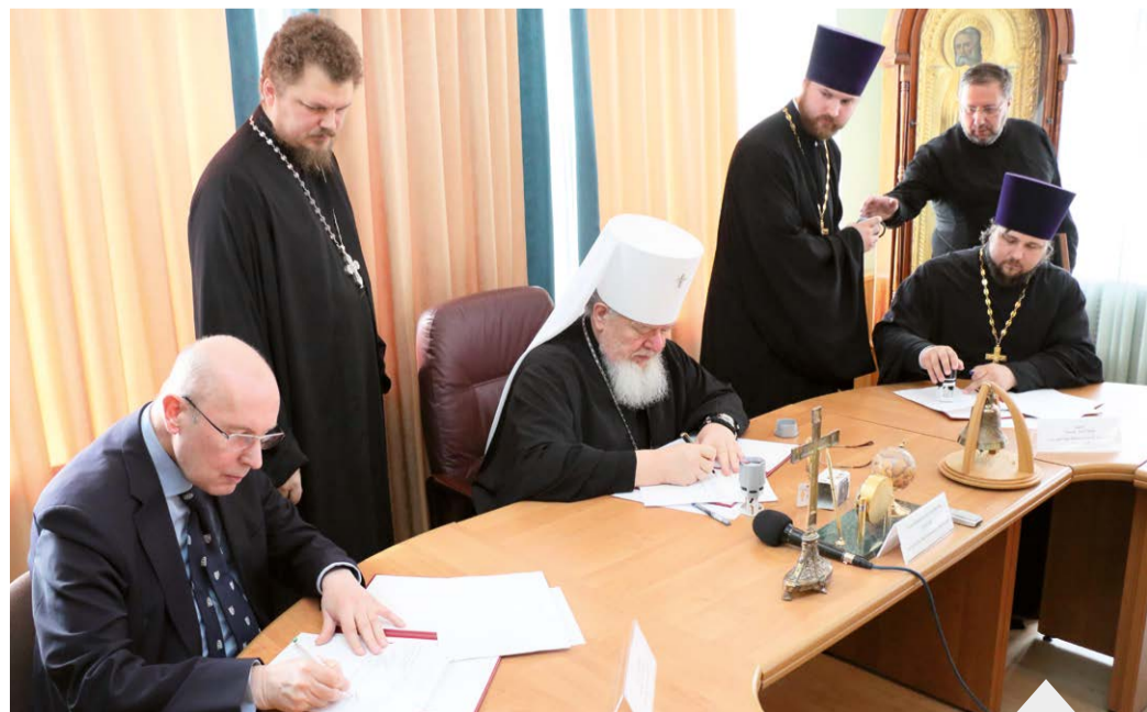
Подписание договора о трехстороннем сотрудничестве

Участники конференции затрагивали самые разные темы: от собственного опыта создания коллекций до проблемных вопросов. Главные из них – это статус малых музеев, поддержка их развития, нормативно-правовое поле. Всего было заслушано более 20 докладов.