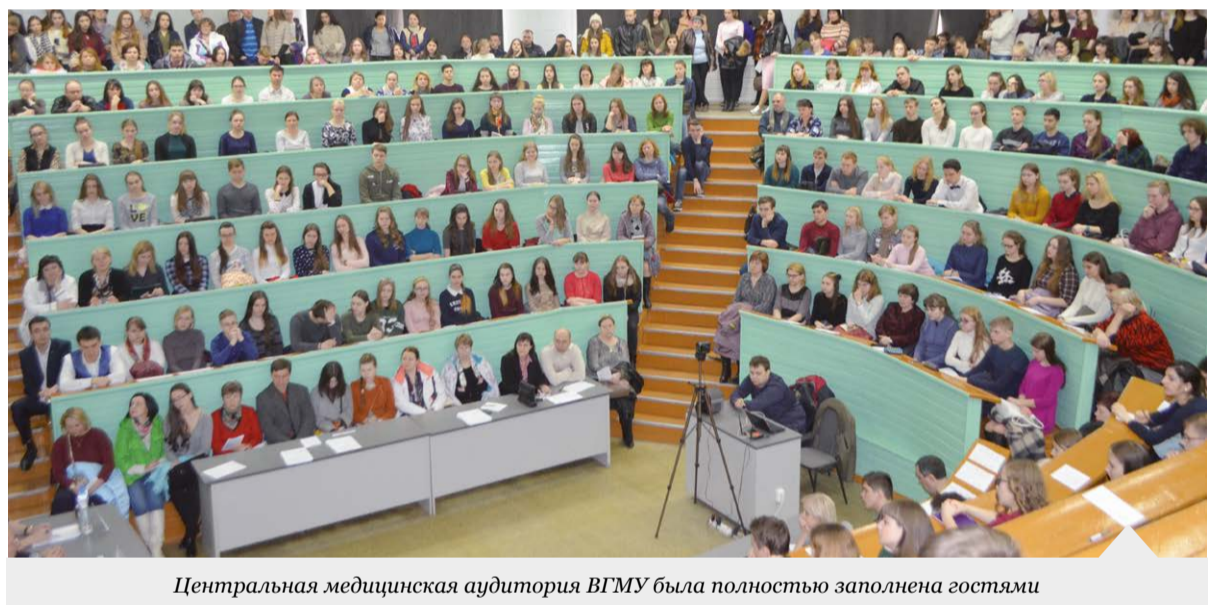
Центральная медицинская аудитория ВГМУ была полностью заполнена гостями

Мы также очень рады видеть в стенах университета молодых