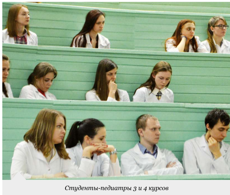
Студенты-педиатры 3 и 4 курсов

24 марта в ЦМА прошел «День карьеры» педиатрического факультета для студентов 3-го и 4-го курсов. Центр маркетинга и деканат педфака пригласил на встречу педиатров-выпускников ВГМУ разных лет. Все они – прекрасные специалисты, пользующиеся огромным уважением в медицинских кругах и у населения Воронежской области.