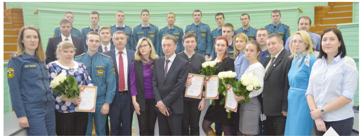
Участники конференции вместе с членами организационного комитета после продуктивной беседы