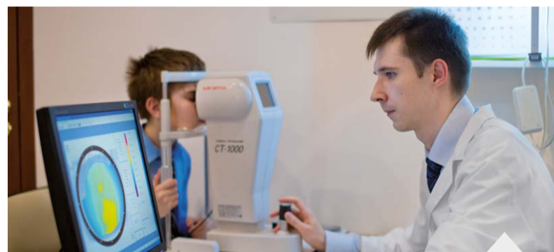
Лидером среди причин слепоты и инвалидности по зрению является глаукома

Стоит отметить, что в рамках клуба уже с 2015 г. проводится клиническое исследование годового градиента прогрессирования миопии – самой распространенной офтальмологической патологии в детском возрасте. Содружество сотрудников кафедры офтальмо-