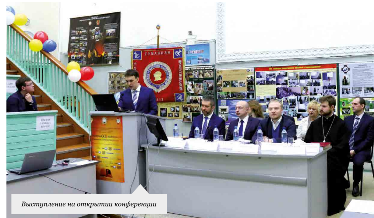
Выступление на открытии конференции