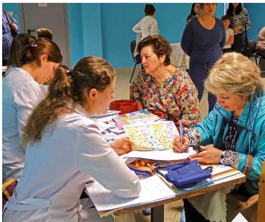
Консультируют специалисты ВГМУ им Н.Н. Бурденко