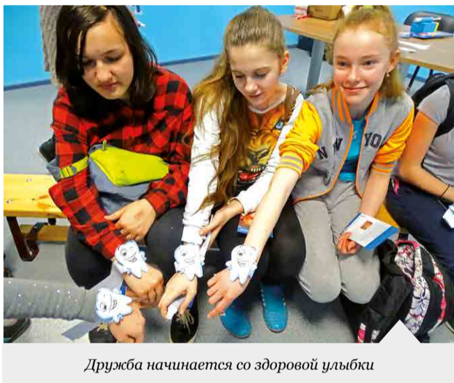
Дружба начинается со здоровой улыбки