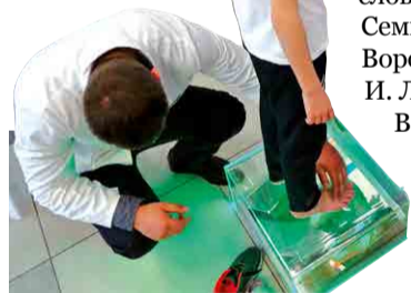
Проверка плоскостопия у детей