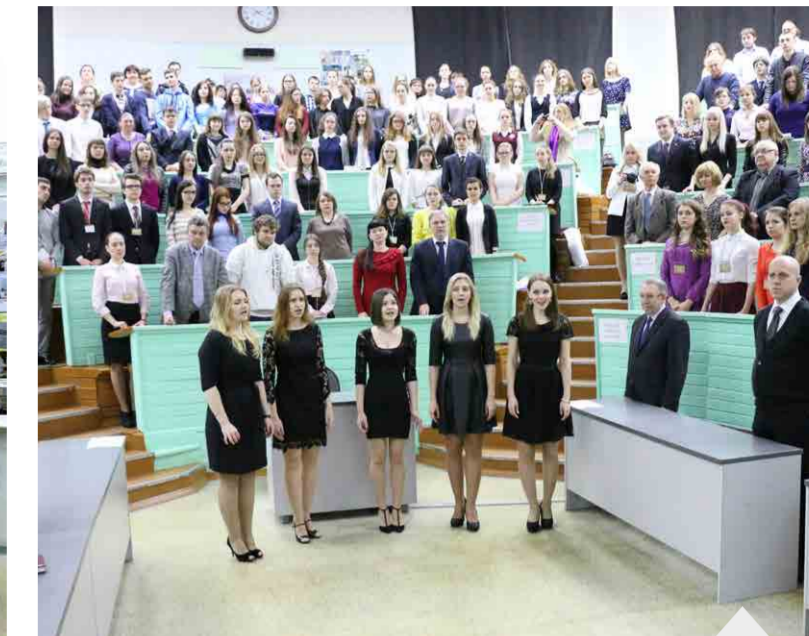
Исполнение студенческого гимна Gaudeamus