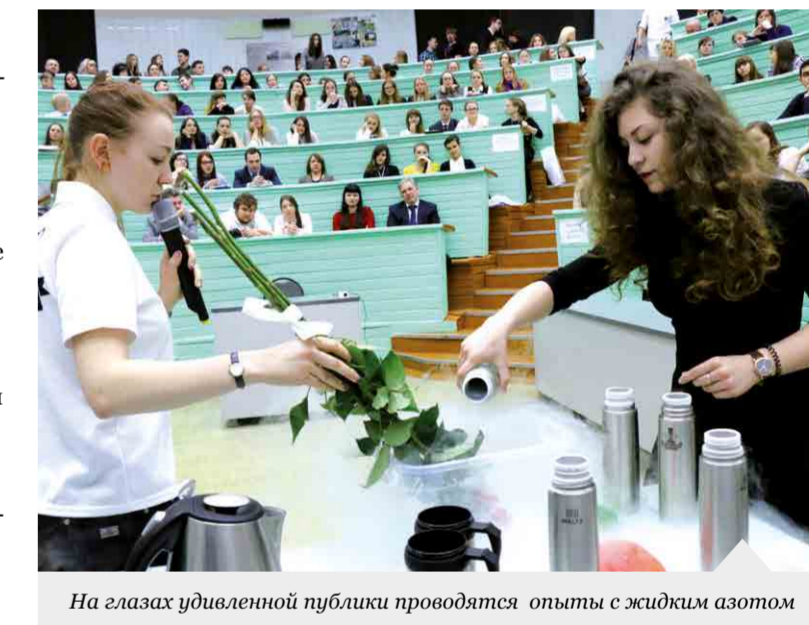
На глазах удивленной публики проводятся опыты с жидким азотом